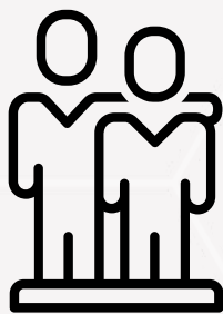
Motivación e Implicación

+ Damos especial importancia a la dimensión afectiva y emocional en nuestras sesiones. Los últimos estudios en el campo de la neuroeducación demuestran que la única manera de aprender es emocionarse. Seguimos este esquema